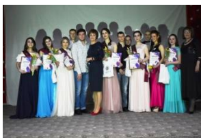
«Мисс Ачинский медицинский техникум – 2020»